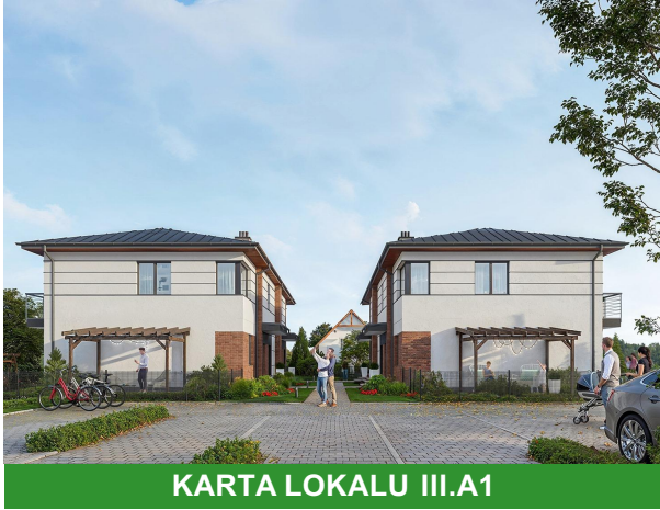
KARTA LOKALU III.A1